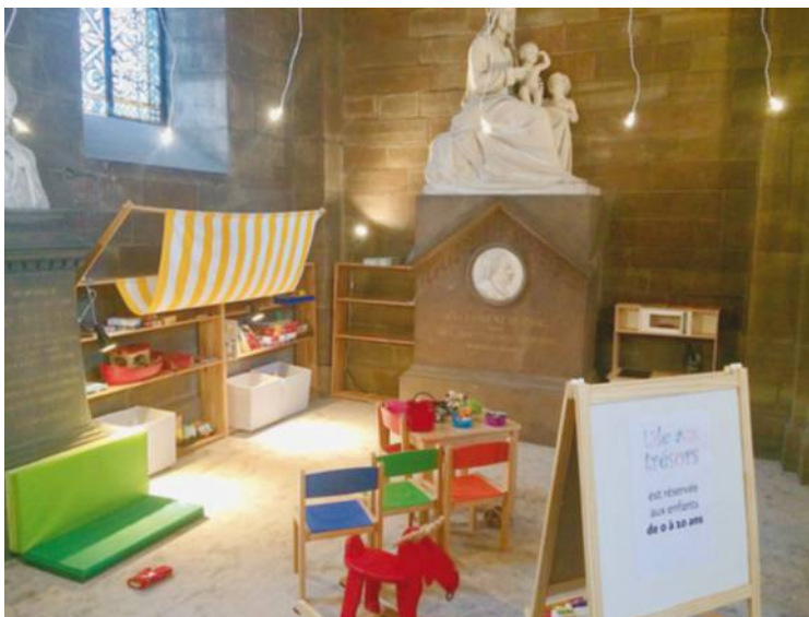
À Strasbourg, le Temple-Neuf a aménagé à l'intérieur même de l'église un espace réservé aux moins de 10 ans. Temple-Neuf de Strasbourg