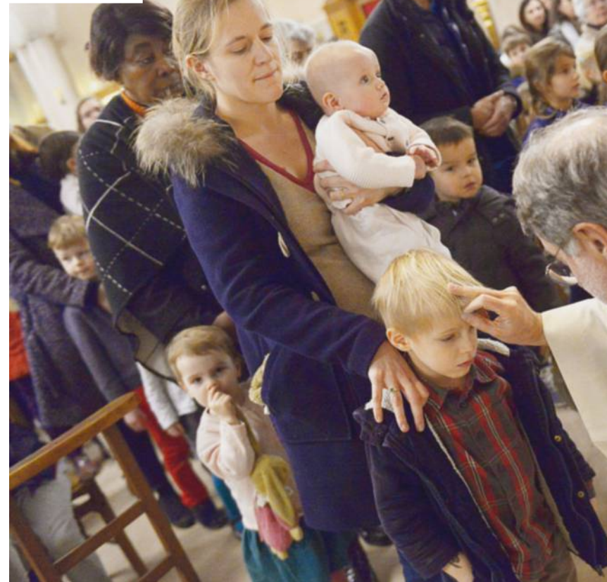
Messe des Cendres à l'église Saint-Ferdinand des Ternes à Paris.

gogie de la prière par des postures qui rendent grâce pour ce que Dieu nous donne – un corps, des sens, un esprit, une intelligence, ajoutée-elle. C'est une manière d'ouvrir à l'intériorité, fondée sur des techniques de respiration, de concentration, d'attention pour être présent à soi, aux autres et à Dieu. »