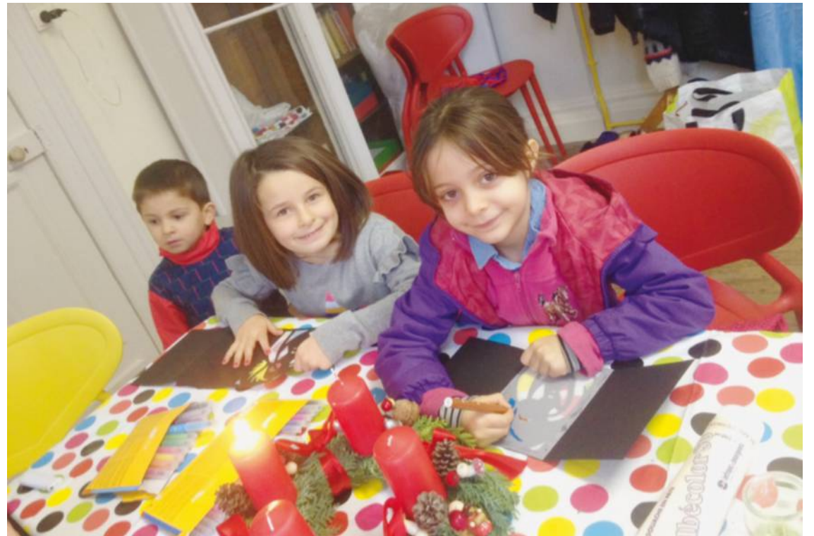
Atelier d'éveil biblique au temple protestant de Roubaix. Église protestante unie de France

(2) Lire Le Yoga des petits, d'Élisabeth Jouanne, Bayard Éd.